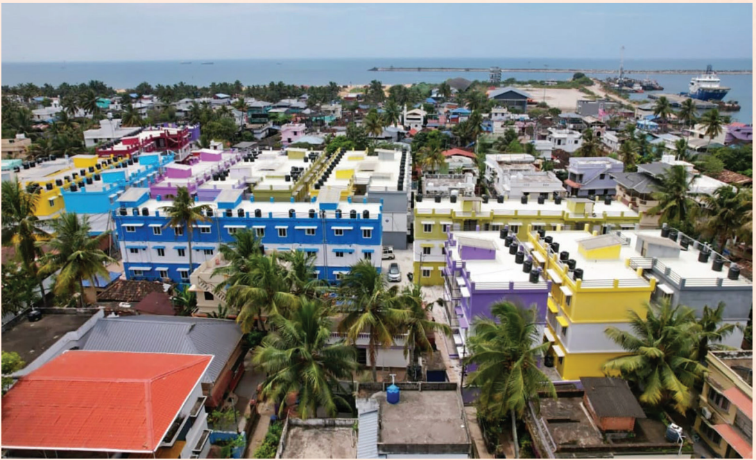
ക്യൂ.എസ്.എസ്. കോളനി, കൊല്ലം

80 വ്യക്തിഗത ഫ്ലാറ്റ് നിർമ്മാണത്തിനുള്ള ദർഘാസ് നടപടികൾ പൂർത്തീകരിച്ചു വരുന്നു.