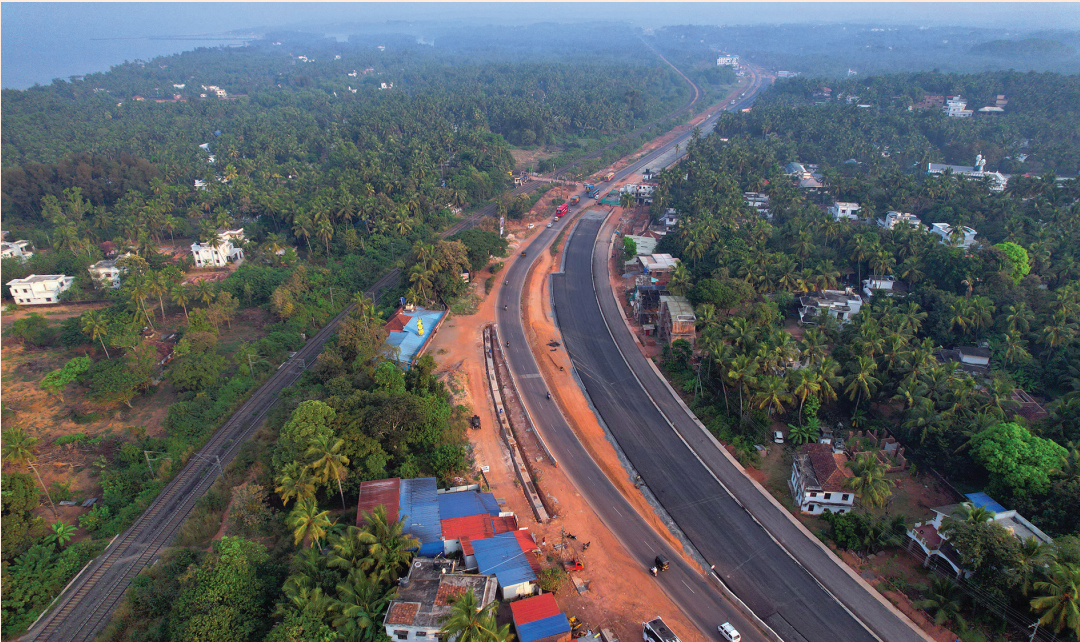
എൻ.എച്ച്.- 66 തലപ്പാടി- ചെങ്ങള

തിരുവനന്തപുരം-വിഴിഞ്ഞം-പാരിപ്പള്ളി ഔട്ടർ റിംഗ് റോഡിന് കേന്ദ്ര ഉപരിതല ഗതാഗത മന്ത്രാലയം അനുമതി നൽകി. ദേശീയപാതാ അതോറിറ്റിയാണ് നിർമ്മാണം നടത്തുക .