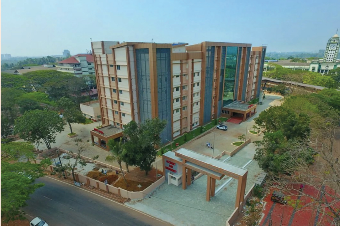
നടപ്പുസൂപ്പർ സ്പെഷ്യാലിറ്റി ബ്ലോക്ക്, കോഴിക്കോട് മെഡിക്കൽ കോളേജ്

നിർമ്മിക്കുന്നതിന് ഭരണാനുമതി നൽകിയിട്ടുണ്ട്. സാമ്പത്തികാനുമതി ലഭ്യമാക്കി നിർമ്മാണം നടത്തുന്നതിനുള്ള നടപടികൾ സ്വീകരിച്ച് വരുന്നു. കോന്നി മെഡിക്കൽ കോളേജിന്റെ രണ്ടാംഘട്ട നിർമ്മാണ പ്രവർത്തനങ്ങൾക്ക് 218 കോടി രൂപയുടെ സാമ്പത്തികാനുമതി കിഫ്ബി വഴി ലഭ്യമായതിന്റെ ഭാഗമായി മെഡിക്കൽ കോളേജിന് ആവശ്യമായ കാർട്ടേജ്സ്, ആശുപത്രി ബ്ലോക്കിന്റെ രണ്ടാം ഘട്ടം, വിദ്യാർത്ഥികളുടെ ഹോസ്റ്റലുകൾ മുതലായവ നിർമ്മാണം ആരംഭിച്ചിട്ടുണ്ട്. ഇതിൽ ഹോസ്റ്റലുകളുടെ നിർമ്മാണം അവസാന ഘട്ടത്തിലാണ്. കോന്നി മെഡിക്കൽ കോളേജിന്റെ ആദ്യഘട്ട നിർമ്മാണ പ്രവർത്തനങ്ങൾ പൂർത്തിയാക്കുന്നതിനും ഉപകരണങ്ങളും, ഓപ്പറേഷൻ തീയറ്ററുകൾ സജ്ജീകരിക്കുന്നതിനുമായി 19.5 കോടി രൂപ കിഫ്ബി വഴി അനുവദിക്കുകയും, ടി നിർമ്മാണ / വാങ്ങൽ നടപടികൾ പുരോഗമിച്ചു വരുന്നു. എറണാകുളം മെഡിക്കൽ കോളേജിന്റെ പുരോഗതിയ്ക്കായി 285.31 കോടി രൂപ കിഫ്ബി വഴി അനുവദിച്ച പുതിയ സൂപ്പർ സ്പെഷ്യാലിറ്റി ആശുപത്രി കെട്ടിടം നിർമ്മിച്ചു വരുന്നു. നിർമ്മാണം അവസാനഘട്ടത്തിലാണ്. തിരുവനന്തപുരം മെഡിക്കൽ കോളേജിന്റെ സമഗ്ര വികസനത്തിനായി കിഫ്ബി വഴി 717 കോടി രൂപയുടെ അനുമതി നൽകുകയും, ഇതിൽ 58 കോടി രൂപയുടെ ആദ്യഘട്ട നിർമ്മാണ പ്രവർത്തനങ്ങളുടെ ഭാഗമായി മെഡിക്കൽ കോളേജിലെ 6 പ്രധാന റോഡുകളും, യാത്രാക്കുരുക്ക് പരിഹരിക്കുന്നതിനായി നിർമ്മിച്ച മേൽപ്പാലത്തിന്റെയും നിർമ്മാണങ്ങൾ പൂർത്തിയാക്കിയിട്ടുണ്ട്. രണ്ടാം ഘട്ട നിർമ്മാണ പ്രവർത്തനങ്ങൾക്ക് 194.32