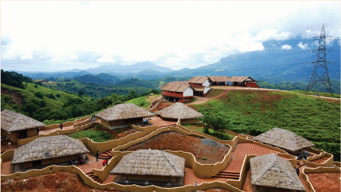
‘എൻ ഉൾ’പുക്കോട്, വയനാട്

100. അന്താരാഷ്ട്ര ടൂറിസം വിപണിയുടെ ശ്രദ്ധ ആകർഷിക്കാൻ 2022 കോവിഡ് മുക്തവർഷമായി ആഘോഷിക്കും. പുതിയ പദ്ധതികൾ ആവിഷ്കരിക്കാൻ സ്വകാര്യ സംരംഭങ്ങളെ പ്രോത്സാഹിപ്പിക്കും.