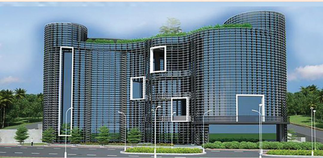
ഡിജിറ്റൽ സയൻസ് പാർക്ക് - മാതൃക

65. സർവകലാശാലകളിൽ നാനോ സാങ്കേതികവിദ്യക്ക് പ്രത്യേക വകുപ്പുകൾ ഇപ്പോഴുണ്ട്. തൊഴിലധിഷ്ഠിത നാനോ സാങ്കേതികവിദ്യാ കോഴ്സുകൾ