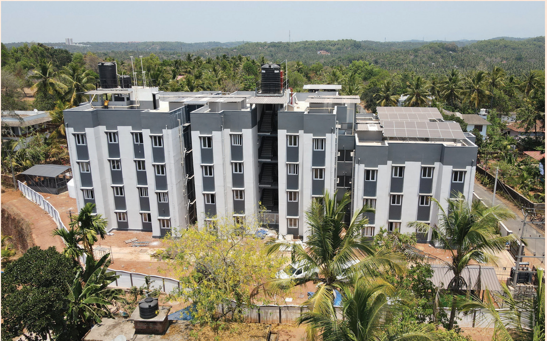
ലൈഫ് വേന സമുച്ചയം, കടമ്പൂർ

542. ലൈഫ് മിഷന്റെ അടുത്ത ഘട്ടത്തിലെ പ്രത്യേകത ഭൂരഹിതർക്കു വീട് നൽകലാണ്. അവർക്ക് ഫ്ളാറ്റുകൾ നിർമ്മിച്ചു നൽകും. അതോടൊപ്പം സ്വന്തമായി സ്ഥലം വാങ്ങി വീട് വയ്ക്കാൻ തയ്യാറുള്ളവർക്ക് 10 ലക്ഷം രൂപ വീതം നൽകും.