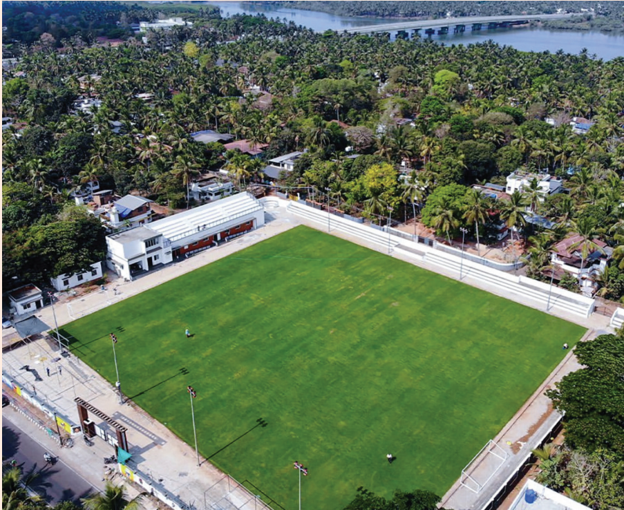
അബു-പാത്തുക്കുട്ടി മിനി സ്റ്റേഡിയം, ധർമ്മടം

ഇതിൽ ഉൾപ്പെട്ടും. 520 കോടി രൂപയുടെ 23 പദ്ധതികൾ സ്പോർട്സ് കേരള ഫൗണ്ടേഷൻ മുഖാന്തിരം നടപ്പാക്കിവരികയാണ്. കേരള സംസ്ഥാന യുവജന ക്ഷേമ ബോർഡിന്റെ അധീനതയിൽ ദേവികുളത്ത് പ്രവർത്തിക്കുന്ന സാഹസിക അക്കാദമി വികസിപ്പിക്കുന്നതിന്റെ ഭാഗമായി പുതിയ കെട്ടിടം നിർമ്മിക്കുന്നതിന് 9,63,84,416/- രൂപയുടെ ഭരണാനുമതി നൽകിയിട്ടുണ്ട്.