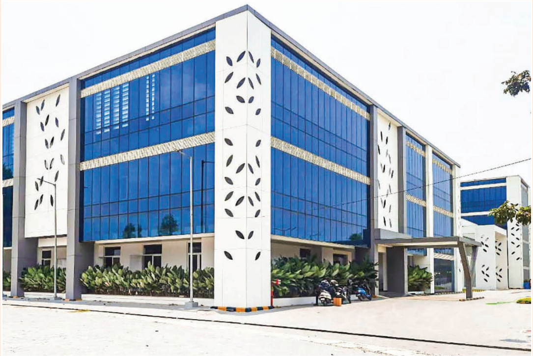
ലൈഫ് സയൻസ് പാർക്ക് തോന്നയ്ക്കൽ

59. വ്യവസായ യൂണിറ്റുകൾക്കുള്ള സ്ഥലസൗകര്യം മാത്രമല്ല, ഗവേഷണത്തിനും മറ്റും വേണ്ടിയുള്ള പൊതുസൗകര്യവും പാർക്കുകളിൽ സൃഷ്ടിക്കും.