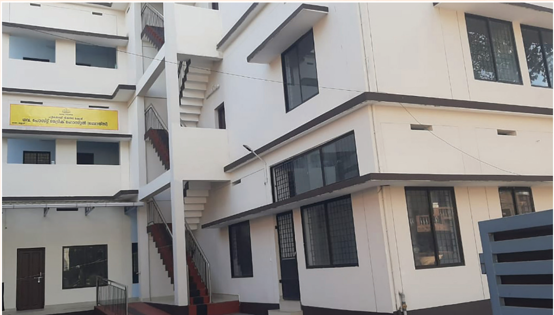
പോസ്റ്റ്മെട്രിക് ഹോസ്റ്റൽ താന കണ്ണൂർ

ഗോത്രസാരഥി പദ്ധതി പട്ടികവർഗ്ഗ വികസന വകുപ്പ് ഏറ്റെടുത്ത് വിദ്യാവാഹിനി എന്ന പേരിൽ നടപ്പിലാക്കും.